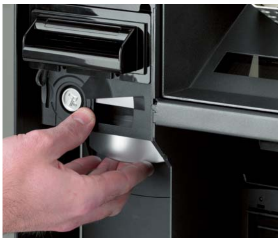
Mecanismo para el desbloqueo del cajetín