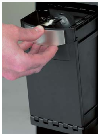
Extracción del cajetín