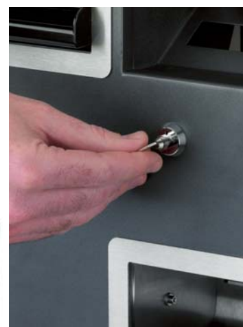
Cerradura del frontal exterior