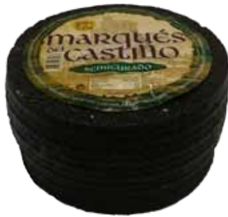
QUESO SEMICURADO MEZCLA