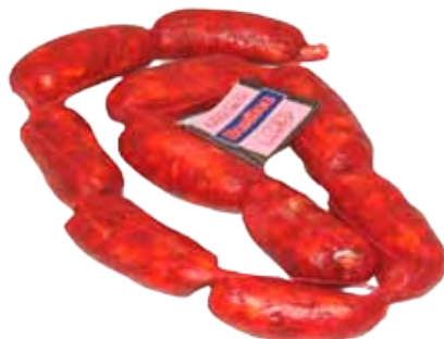
CHORIZO PICANTE DULCE