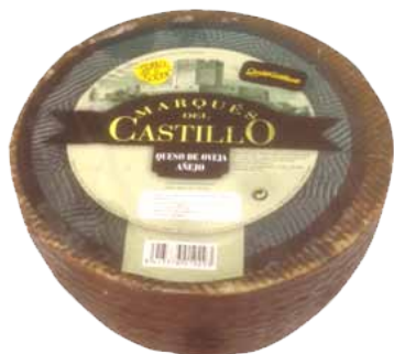
QUESO OVEJA AÑEJO