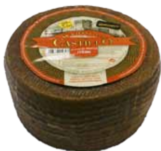
QUESO CURADO MEZCLA