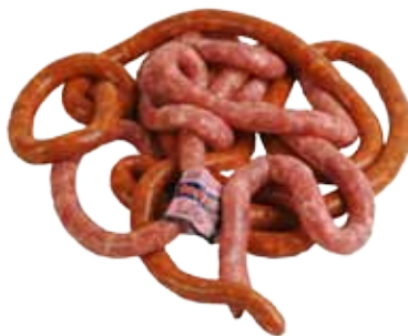
SALCHICHA FINA BLANCA O ROJA