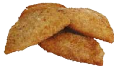
CORDÓN BLEU DE PAVO