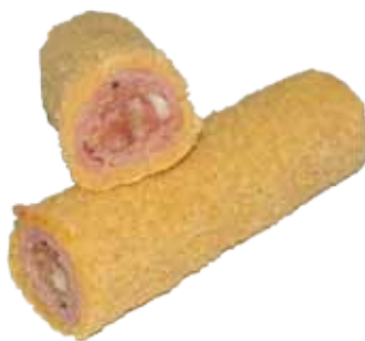
FLAMENQUÍN DE LOMO, SERRANO Y TOCINO IBÉRICO