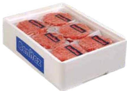
BURGUER DE TERNERA, ANGUS O BUEY