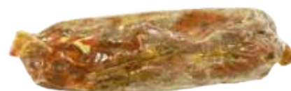
LOMITO DE IBÉRICO DE BELLOTA