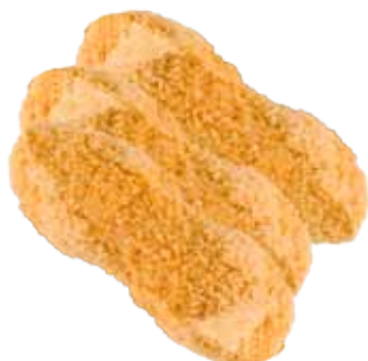
LOMITOS DE POLLO EMPANADOS