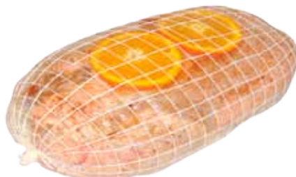
POLLO RELLENO A LA NARANJA