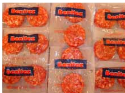
BURGUER MINI DE TERNERA, ANGUS O BUEY