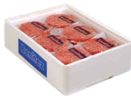
BURGUER DE POLLO