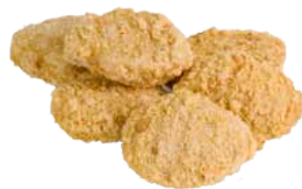
NUGGETS DE POLLO