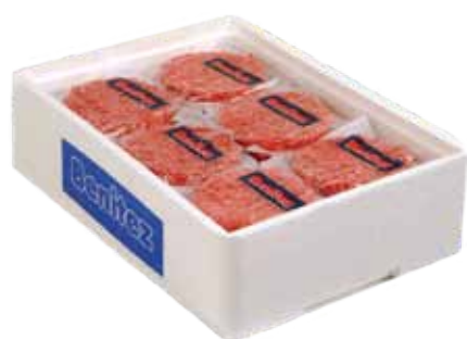
BURGUER DE CERDO