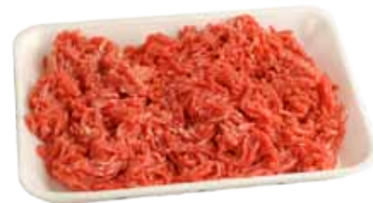
CARNE PICADA DE CERDO, TERNERA, BUEY O MIXTA