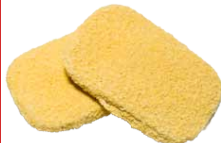
SAN JACOBO DE LOMO, SERRANO Y QUESO