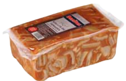
CALLOS DE TERNERA 1/2Kg / 2Kg