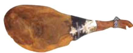
JAMÓN DUROC GRAN RESERVA