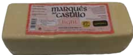
QUESO BARRA LIGHT