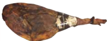
JAMÓN IBÉRICO GUIJUELO