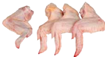
ALAS DE POLLO TEX-MEX