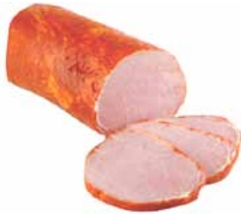
FIAMBRE DE LOMO AL HORNO