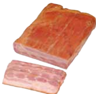
PANCETA AHUMADA SELECCIÓN