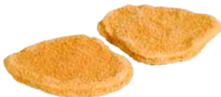
PECHUGAS DE PAVO A LA VIENESA