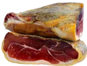
JAMÓN DUROC GRAN RESERVA DESHUESADO