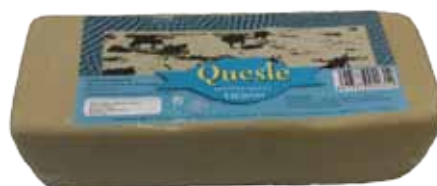
QUESO BARRA MEZCLA