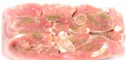
CHULETAS DE PAVO AL AJILLO