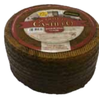
QUESO OVEJA CURADO