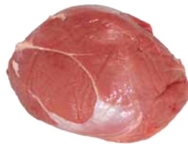
BABILLA DE POTRO LECHAL