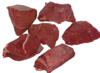
TACOS DE RAGÚ DE CIERVO