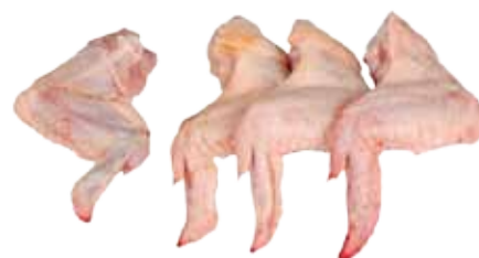
ALAS DE POLLO