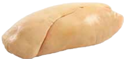
HÍGADO DE PATO