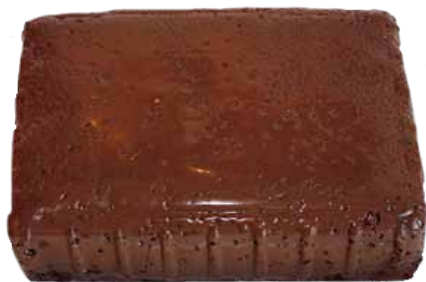
SANGRE DE POLLO