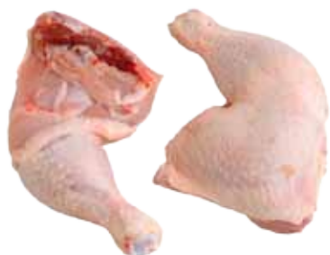
MUSLO Y CONTRAMUSLO DE POLLO DESHUESADO