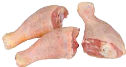
JAMONCITOS DE POLLO