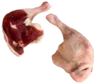
MUSLO DE PATO