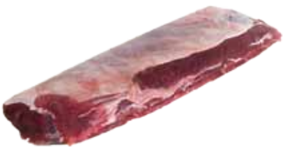
LOMO DE CIERVO