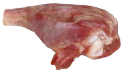
JAMONCITOS DE PAVO