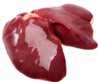
HIGADILLOS DE POLLO