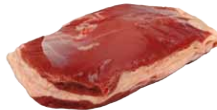
MAGRET DE PATO