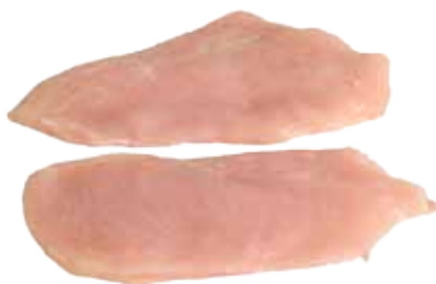
PECHUGA DE POLLO ENTERA/FILETEADA