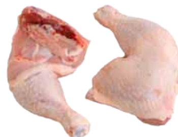
MUSLO Y CONTRAMUSLOS DE POLLO