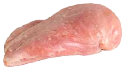
PECHUGA DE PAVO