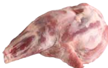
JAMÓN TIPO YORK / CON PIEL