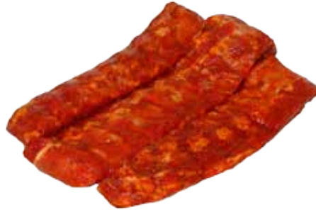
COSTILLAS DE CERDO IBÉRICO