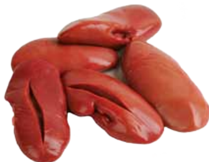
RIÑONES DE CERDO