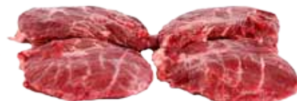
CARRILLADA IBÉRICA GUIJUELO