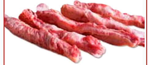
LÁGRIMAS DE CERDO IBÉRICO