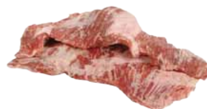
SECRETO CRUCETA GUIJUELO