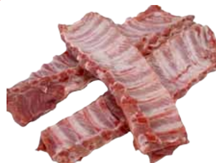
COSTILLAS DE CERDO CHULETERO