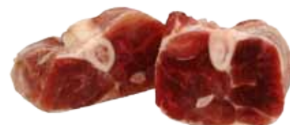
OSSOBUCO DE CERDO ABIERTO / CORTADO