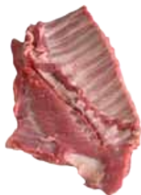
COSTILLA DE CERDO CARNUDA / NORMAL