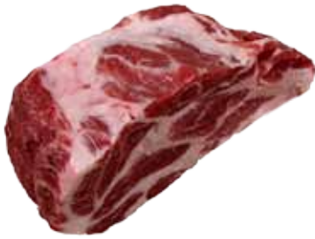
CABEZA DE LOMO IBÉRICO