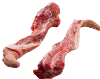
RABO CARNUDO DE CERDO