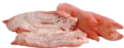
MANOS DE CERDO