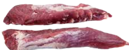
SOLOMILLO DE CERDO IBÉRICO