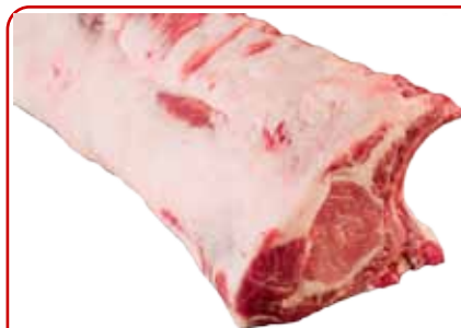
CHULETERO DE CERDO IBÉRICO ENTERO / CORTADO