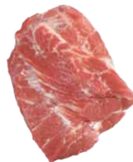
CABEZA DE LOMO DE CERDO