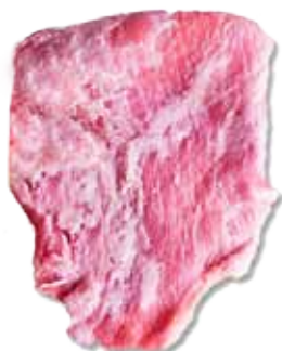
SECRETO BARRIGUERA IBÉRICA