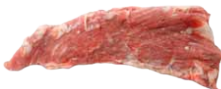
PLUMA DE CERDO DUROC CONGELADO