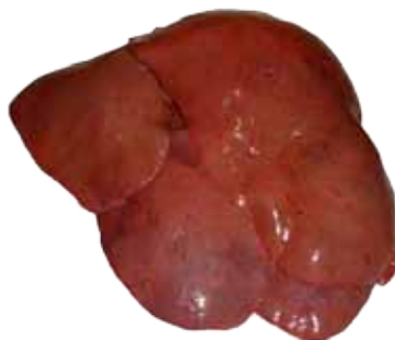
HIGADO DE CERDO