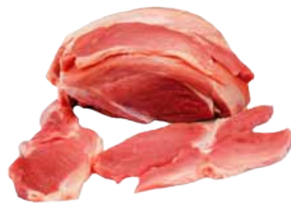
CENTRO DE PALETA DE CERDO FILETEADA