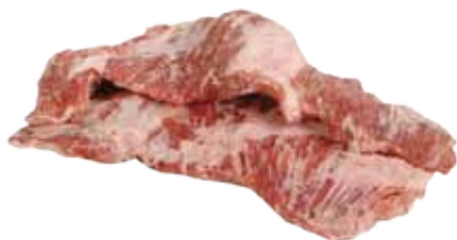
SECRETO DE CERDO DUROC CONGELADO