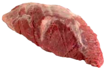
PRESA DE CERDO BLANCO