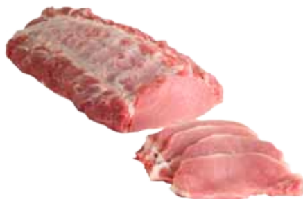
LOMO DE CERDO A FILETES