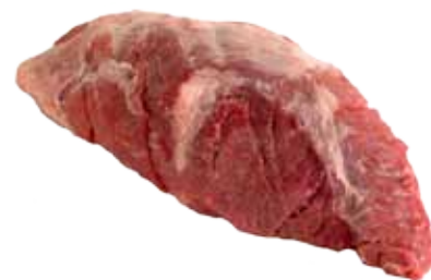
PRESA DE CERDO DUROC