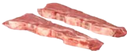
CHURRASCO DE CERDO