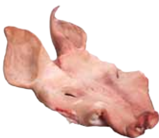
CARETA DE CERDO