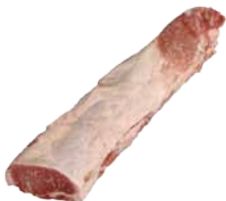
LOMO DE CERDO IBÉRICO