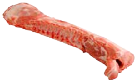
CHULETERO CON CABEZA / SIN CABEZA