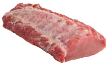
LOMO DE CERDO ENTERO