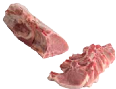
CHULETERO CON CABEZA / SIN CABEZA