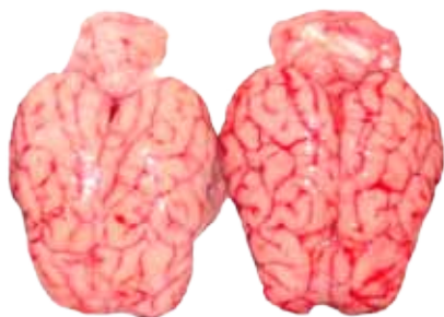
SESADA DE CERDO