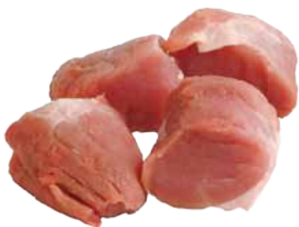
PUNTAS DE SOLOMILLO DE CERDO