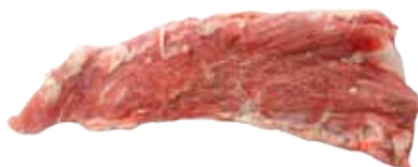
PLUMA IBÉRICA GUIJUELO