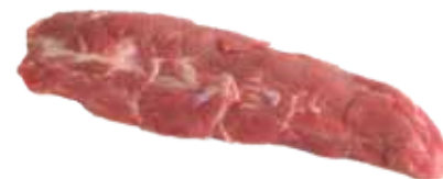
SOLOMILLO DE CERDO / ESPECIAL