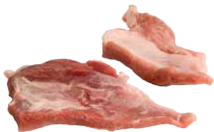
SECRETO DE CERDO BLANCO