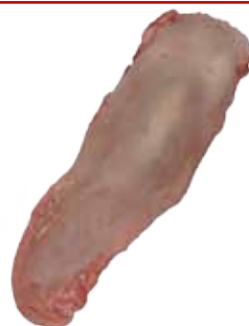
LENGUA DE CERDO