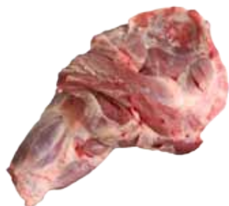
PALETA TIPO YORK