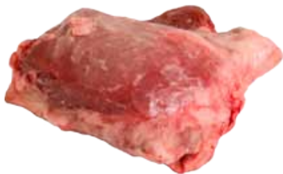
CARRILLADA DE CERDO CON HUESO / SIN HUESO