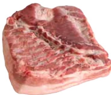
PANCETA FRESCA / FILETEADA