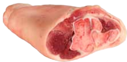
CODILLO DE CERDO ENTERO / CORTADO