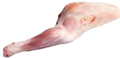
PALETILLA DE CORDERO LECHAL