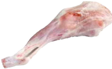
PIERNA DE CORDERO LECHAL