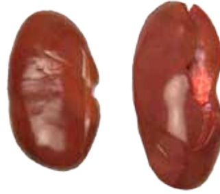
RIÑONES DE CORDERO