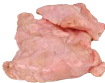
MOLLEJAS DE CORDERO