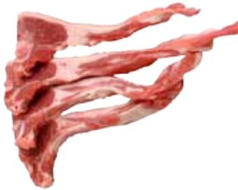
BANDA DE CORDERO CORTADA