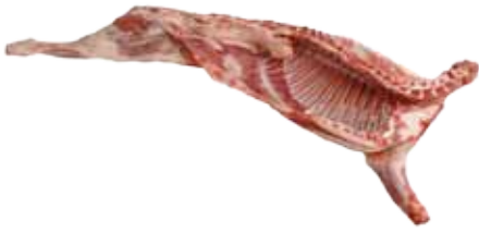
CORDERO NACIONAL 10-13 / 13-16