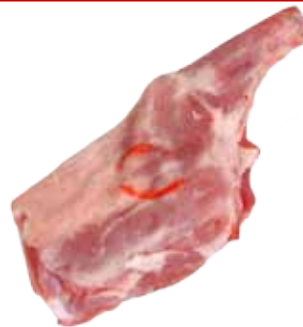
PALETILLA DE CABRITO