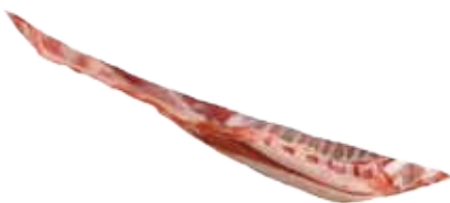
PUNTAS DE PECHO DE CABRITO