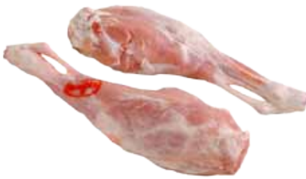
PIERNA DE CABRITO