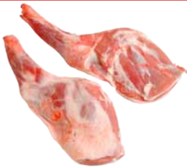
PALETILLA DE CORDERO