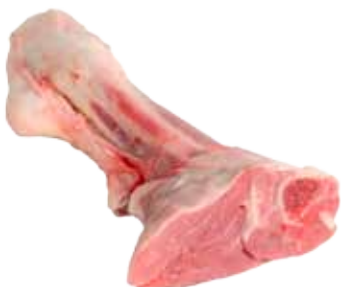
CODILLOS DE CORDERO