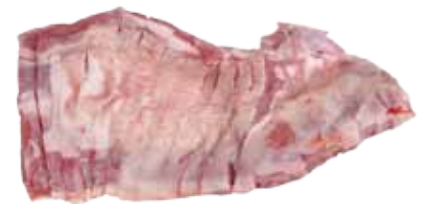
BANDA DE CABRITO ENTERA / CORTADA