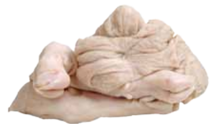
CUELLO DE CORDERO