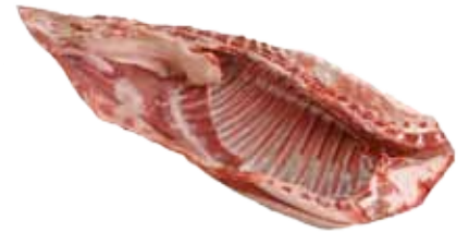
BANDA DE CORDERO ENTERA