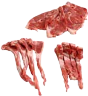
CORDERO A FILETES 10-13 / 13-16