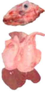
DESPOJO DE CORDERO C. CAB/S. CAB.