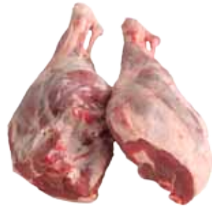
PIERNA DE CORDERO ENTERA / CORTADA