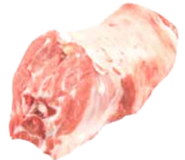
CUELLO DE CORDERO