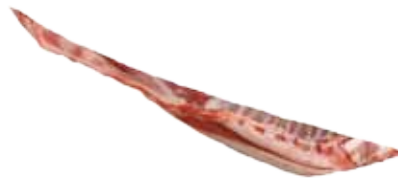
PUNTAS DE PECHO DE CORDERO