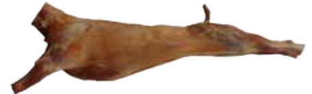
CANAL DE CABRITO 4-6 / 6-8