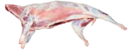
CORDERO LECHAL 6-8