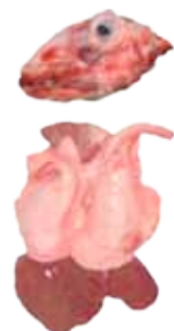
DESPOJO DE CABRITO CON CABEZA