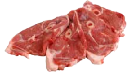
FILETE PIERNA DE CORDERO