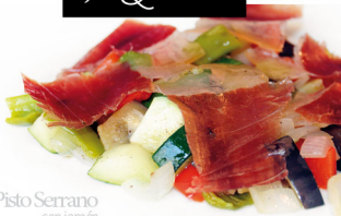
Pisto Serrano con jamón