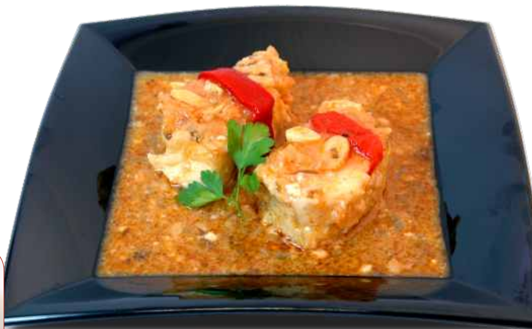
Bacalao ajoarriero / Cod ajoarriero