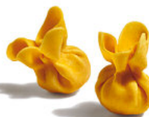
Sacchetti al Pesto

Cod. RAV01 - Mono Dosis de 140 g. - Tiempo Cocción: 2 min. Porción Final, con Salsa: 276 g.