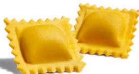
Ravioles Ricota y Espinacas

Cod. RAV02 - Mono Dosis de 140 g. - Tiempo Cocción: 2 min. Porción Final, con Salsa: 276 g.