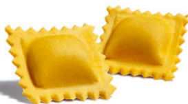
Ravioles de Carne

Sémola de Trigo Duro, Huevos y Agua. Rellenos con Carne de Ternera, Caldo Vegetal, Zanahorias, Espinacas, Hierbas Finas, Apio, Cebolla, Ajo, Pulpa de Tomate, Pan Rallado, Especies, Sal, Aceite de Girasol