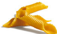
Garganelli al Huevo

Cod. PAS01 Mono Dosis de 140 g. Tiempo Cocción: 1,30 min. Porción Final, con Salsa: 276 g.