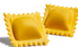
Ravioles Salmón Ahumado

Cod. RAV04 - Mono Dosis de 140 g. - Tiempo Cocción: 2 min. Porción Final, con Salsa: 276 g.