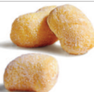
Ñoquis de Patatas

Cod. PAS06 Mono Dosis de 140 g. Tiempo Cocción: 1,30 min. Porción Final, con Salsa: 276 g.