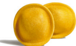
Lunette 5 Quesos

Cod. GNR01 - Mono Dosis de 140 g. - Tiempo Cocción: 1 min. Porción Final, con Salsa: 276 g.