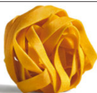
Tagliatelle al Huevo

Cod. PAS04 Mono Dosis de 140 g. Tiempo Cocción: 1,30 min. Porción Final, con Salsa: 276 g.