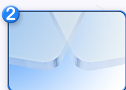
Cristal Templado Resistente y brillante