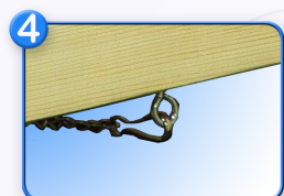
Cadena de acero Gran estabilidad