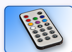
Control Remoto Comodidad y rapidez