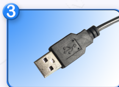
Conectividad LED 5050 Bajo consumo